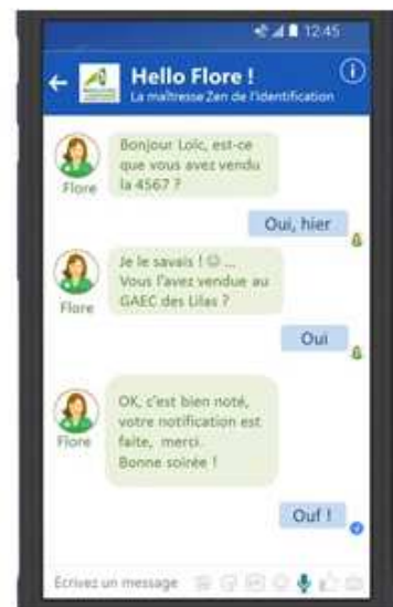
Vues de l'application Margo et Flore