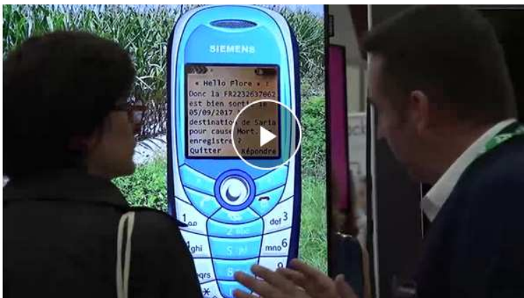
Pour voir la vidéo cliquez sur l'image

https://www.espace-sciences.org/sciences-ouest/355/actualite/des-assistants-virtuels-au-service-des-eleveurs